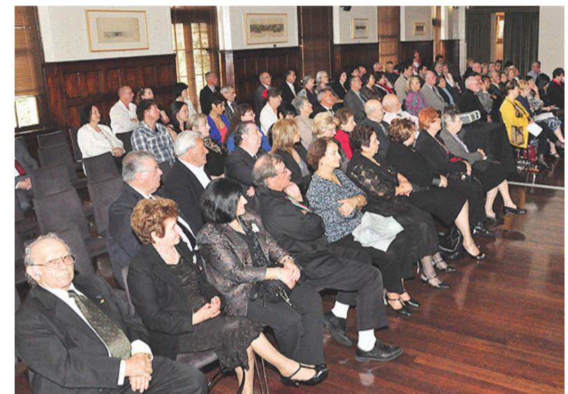
Parte del pubblico presente alla cerimonia