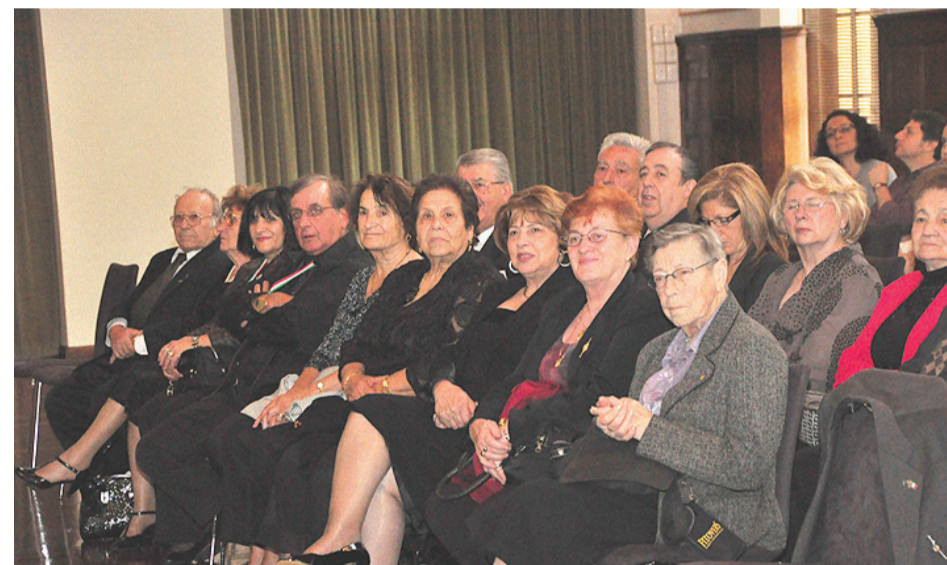
Il pubblico nel salone dell'Università' di Sydney