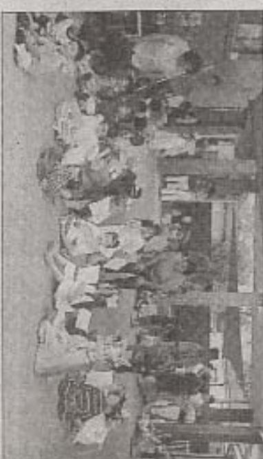
Una ripresa dei bambini mentre recitano