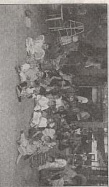
Alcuni bambini in attesa dell'entrata in scena