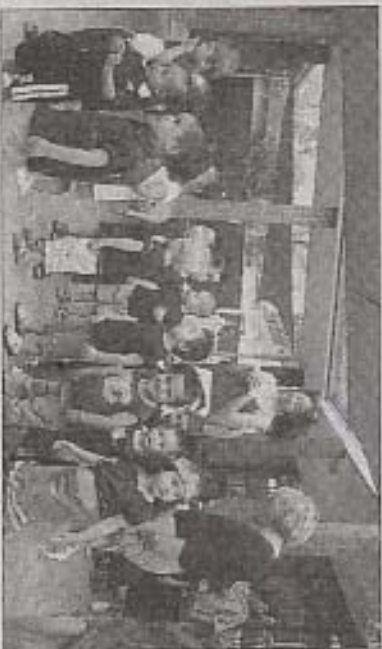
Ultimi preparativi prima di presentarsi al pubblico