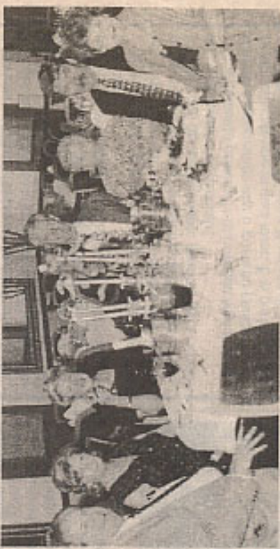
Una tavolata di partecipanti alla festa di chiusura dell'anno