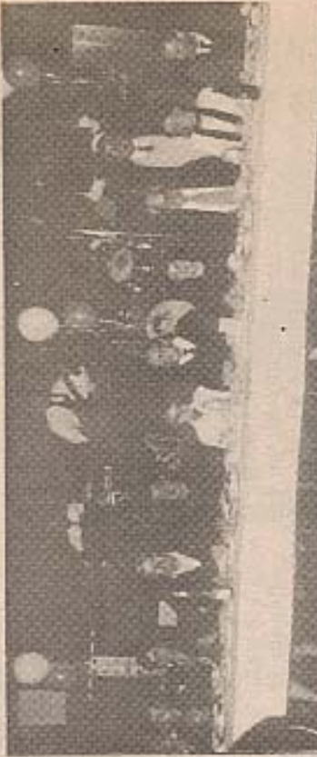
Il tavolo degli ospiti d'onore.

Ha suonato il quartetto Valentino che ha