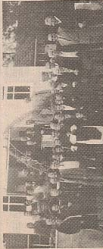
I partecipanti alla messa in occasione del settimo anniversario con padre Silvio.